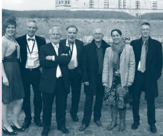
Nederlandse delegatie bij ISO 26000 bijeenkomst Kopenhagen.

ING-bank: 248 35 48 redactie: Gerard Oonk vormgeving: Marjan Gerritse druk: Badoux, Nieuwegein ISSN: 1389-8981