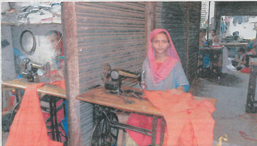
Dat leuke shirt dat je voor maar vijf euro koopt, is maar al te vaak gemaakt door een kind in Cambodja of India.

TIPS. Door eerlijke kleding te kopen, help je zelf mee aan een wereld zonder kinderarbeid. Ga eens kijken in de winkel Nukuhiva van Floortje Delsing in Amsterdam en Utrecht. Bij webwinkel Nikabella kun je verantwoord kleding kopen. En wat trouwens te denken van het mobieltje waar je mee belt? Bij makt'Fair kun je verantwoord elektronica kopen. Voor ondernemers die interesse hebben in kinderarbeidvrije handel is er een uitgewerkt stappenplan. METRO