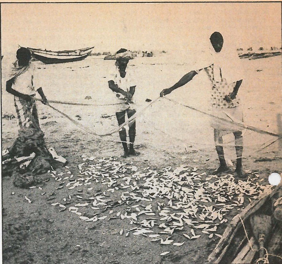
● De schamele vangst is binnen gehaald.