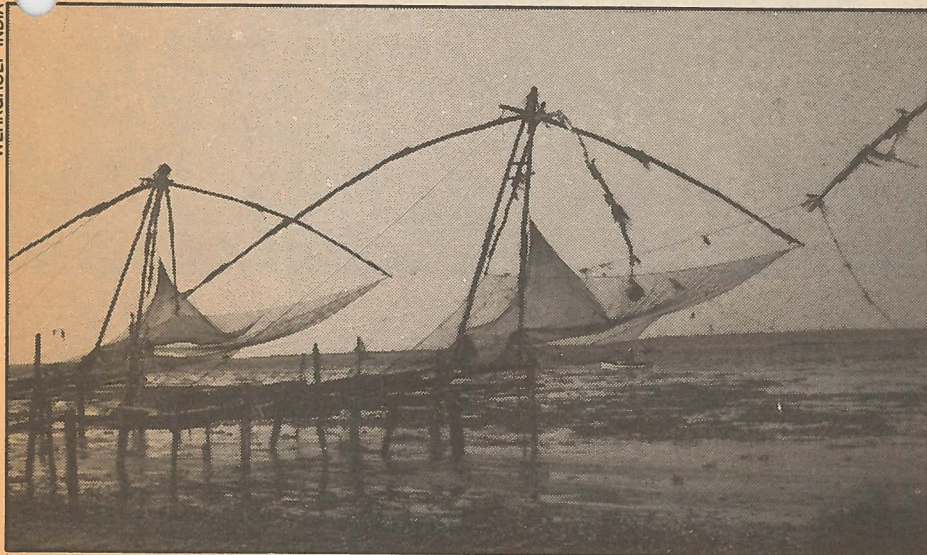
● Langs de Indiase kust wordt veel met kustnetten gevisst.

Aangezien deze informatie blijkbaar geen aanleiding is geweest voor De Koning zijn plannen om 17 trawlers te leveren te wijzigen voordat hij door diverse kanten onder druk werd gezet, lijkt de vraag ge-